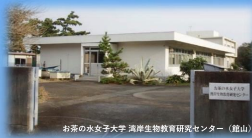
お茶の水女子大学 湾岸生物教育研究センター（館山）