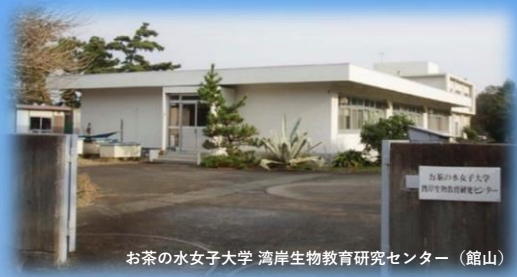
お茶の水女子大学 湾岸生物教育研究センター（館山）