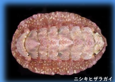
ニシキヒザラガイ